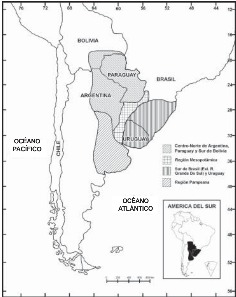
Fig. 2. Distribución geográfica de las regiones consideradas en el texto.

Argentina, Paraguay y sur de Bolivia indicaría mayormente, a partir de su gran parecido con aquella de la región Pampeana, condiciones más frías y áridas o semiáridas, con un marcado predominio de ambientes abiertos. Asimismo, habrían existido breves periodos más húmedos y, posiblemente, un poco más cálidos. Por otro lado, la fauna de la Mesopotamia, sur de Brasil y oeste de Uruguay, se asociaría a condiciones ambientales más benignas, esto es, más húmedas y cálidas.